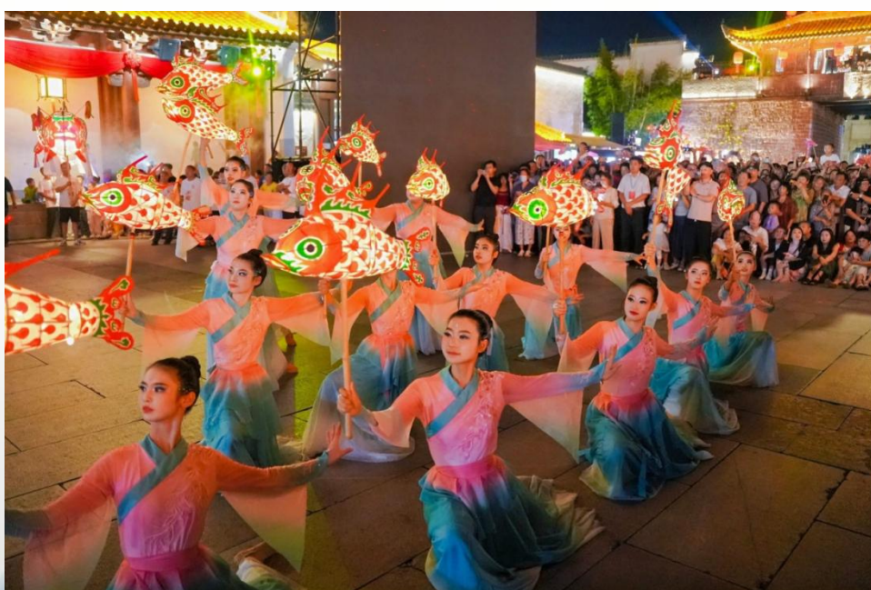
图 23 舞蹈类原创文艺作品《鱼影润新安》

双方以徽州特色“鱼”文化为核心纽带，深入挖掘地域文化内涵，共同打造系列舞蹈类原创文艺作品。继《鱼影润新安》成功引爆全网后，重点打造《鱼跃龙门》系列标杆作品。歙州农文旅集团负责提供专业演出平台、外聘行业创作教师、保障相关创作及演出经费；徽州师范学校则负责组织学生、进行作品创意构思、专业艺术指导及节目编排、演出。双方紧密合作，确保作品兼具高艺术水准与强文化传播价值，作品版权归双方共同所有，实现了文化与艺术的完美融合。