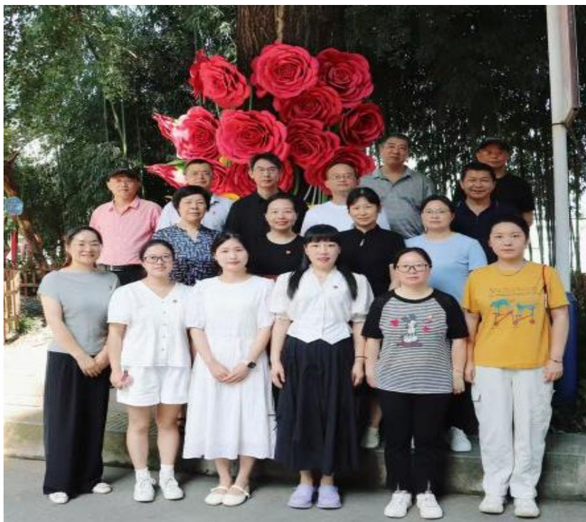
图 24 7 月 1 日党的生日，学校第一党支部党员合影留念

月 1 日党的生日这个特殊而光荣的日子里，学校一支部举行党员纳新仪式，顺利吸纳一名优秀同志入党，为党员队伍增添了新生力量，激发了支部党建工作的生机与活力。在做好党员发展的同时，注重加强日常教育管理，规范开展组织生活会、民主评议党员、谈心谈话、“三会一课”和主题党日活活动，引导党员在教育教学、学生管理和服务师生中亮身份、作表率，发挥先锋模范作用。