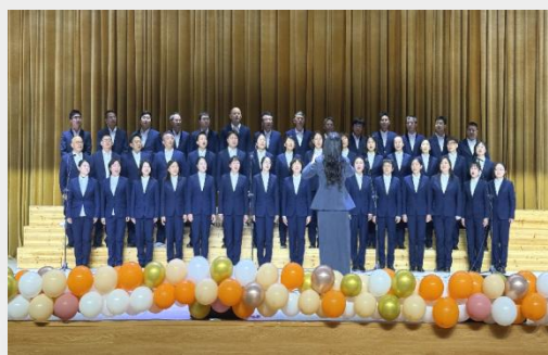
图 17 黄山炎培职业学校赴南京开展红色主题研学游 图 18 黄山旅游管理学校金秋合唱节