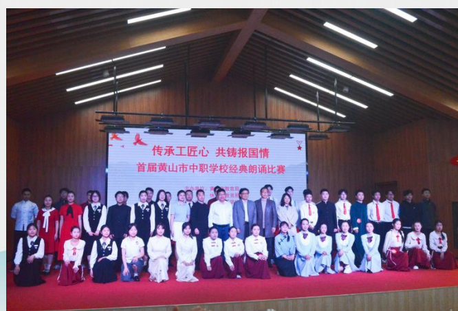
图 16 开展首届黄山市中职学校经典朗诵比赛

间，开展“劳动最光荣 奋斗谱新篇”国旗下讲话，实施“一日三扫”卫生责任制，成立校园卫生监督队，培养学生劳动习惯。安徽省徽州师范学校举行“我知我行”学生风采展示活动，共计开展6场，展现学生青春风采。黄山旅游管理学校以电影《长安三万里》为切入点，成功举办《新起点，蜕变新皮肤》的职业生涯规划主题讲座，引导学生树立清晰的学习目标，探索个性化的成长路径。安徽省行知学校结合各专业特点，开展“最美实训室”“技能劳动标兵”评选，营造尊重劳动、崇尚技能的氛围。休宁徽匠学校组织开展团员微故事分享、徽州传统木工非遗技艺展示、剪纸艺术创作等活动，大力弘扬中华民族传统美德，把学生技能技艺融入徽州文化。祁门县职业技术学校邀请祁红制作技艺非遗传承人到校开展专题培训，介绍祁红历史渊源、制作工艺与文化价值，让学生深入了解非遗技艺精髓，增强对传统文化的认同感与传承意识。