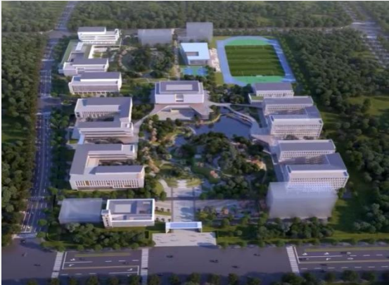
图1 黄山炎培职业学校高新校区鸟瞰图

才链与产业链、创新链“四链融合”，形成“学校服务园区、园区反哺学校”的良性循环。