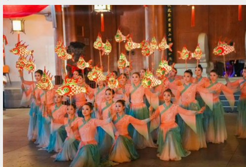
图 19 安徽省徽州师范学校鱼灯表演

并依托省徽派古建产业学院承接住建部相关课程调研，开发古建保护特色课程，推动传统建筑文化与现代职业教育深度融合，2025 年培育非遗专业技能人才超 100 名。 黄山旅游管理学校 为丰富学习体验，特组织“探秘黄山，砺行致远”主题研学活动，组织部分学生在老师带领下徒步攀登黄山，于奇峰、怪石、云海、苍松间亲身体验大自然的鬼斧神工与深厚的地质、生态知识，引导学生将课堂所学与实地考察相结合，在攀登中锤炼坚韧意志，在协作中培养团队精神，于绝胜风光间感悟中华山川之壮美与文化积淀。 2024-2025 年度 全市中职学校累计组织研学活动 10 次，参与学生达 4000 人次。