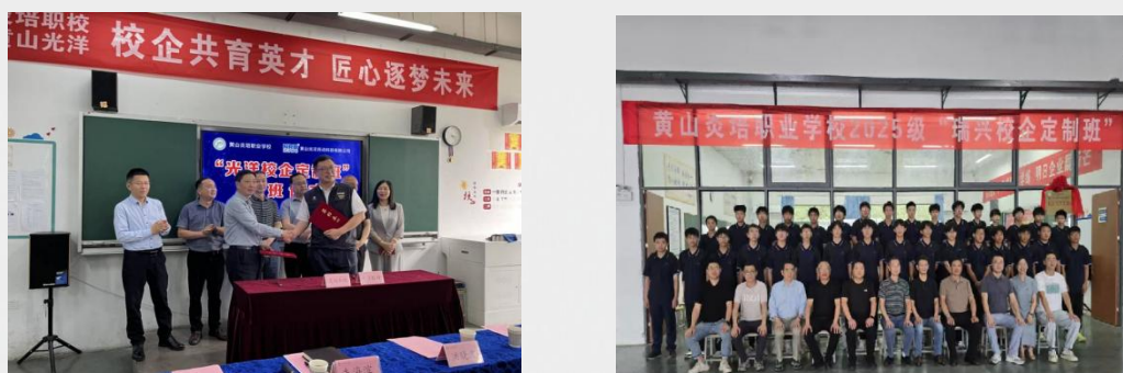
图 24 黄山炎培职业学校定制培养模式

业依托该模式入选区域重点建设专业群，形成“双元共育、岗课对接”的可复制、可推广培养模式，已在市内同类院校推广，年均均为区域产业输送技能人才超 300 名，为区域汽车产业高质量发展注入强劲人才动力。