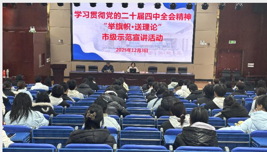
图 27 黄山旅游管理学校学习贯彻党的二十大精神活动

示廉洁诗词、名人名言等内容。举办清廉文化主题活动，如“清廉校园”书画比赛、征文比赛、演讲比赛等，鼓励师生积极参与，以艺术形式表达对清廉的理解与追求，对优秀作品进行展览表彰。利用校园广播、宣传栏、校报校刊等宣传阵地，营造风清气正校园氛围。