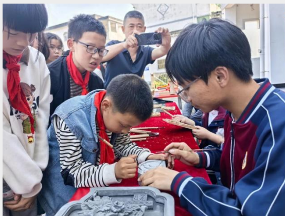
图 23 安徽省行知学校开展非遗职业体验活动