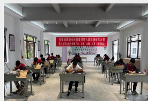
图 14 省徽派古建产业学院技能大赛活动