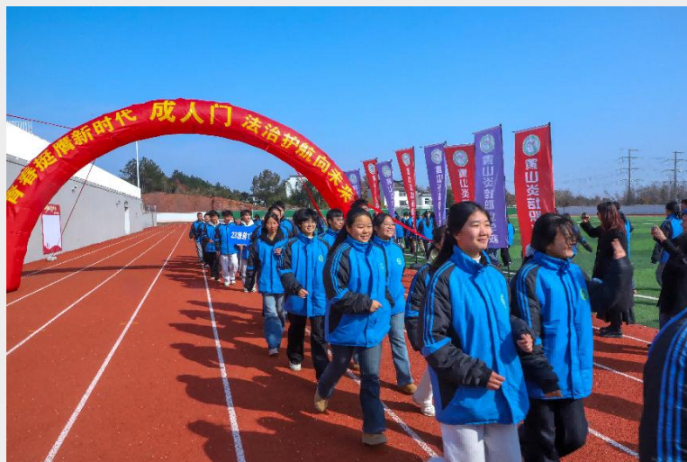
图 26 黄山炎培职业学校承办黄山市中学生 18 岁成人仪式示范活动