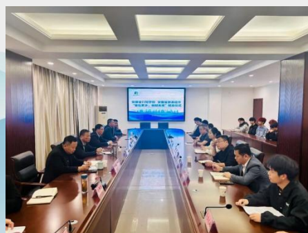
图 7 安徽省行知学校联合歙县经开区举办“留在家乡 创就未来”就业活动