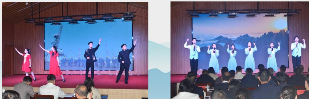
图 22 黄山市首届中职学校经典朗诵比赛现场

三、深化实践探索，明晰未来育人方向。 本次比赛以文化活动为载体，实现思想教育与技能人才培养有机结合。未来，黄山市教育系统将持续深化此类活动，创新形式、丰富内涵，挖掘地域文化与职业教育融合点，强化学生理想信念与职业素养培育，助力中职生成长为新时代技能人才，为地方经济社会发展提供坚实人才支撑。