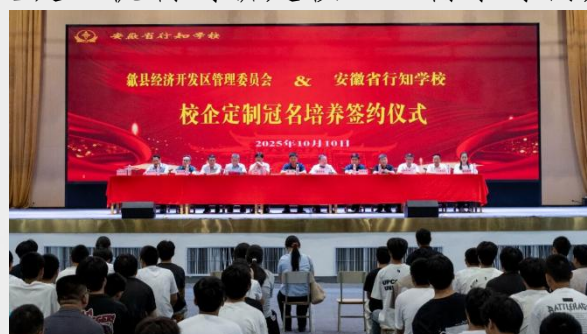
图 25 安徽省行知学校校企定制培养签约仪式

搭建师资共培、资源共享平台，促进职教与普教融通。经验启示为政府统筹是关键、机制创新是核心、需求导向是根本。