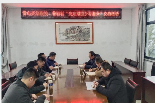
图8 黄山炎培职业学校党建赋能乡村振兴交流活动

各中职学校针对本地乡村地区的实际需求，利用自身专业优势，组建专家技术团队，开设技能培训班，为农业经营主体提供技术服务和智力支持，提高乡村劳动力的技能水平和就业能力，助力农村经济发展。如 黄山炎培职业学校 党总支通过赴曹村村开展“冬送温暖”“夏送清凉”，持续对选派教师关心指导，促其驻村助力乡村振兴。 安徽省徽州师范学校 聚焦霞坑镇里方村发展实际，支持对接农户发展特色种养业，并协助落实省外务工交通补贴，惠及村民，多措并举促进群众稳定增收。 黄山旅游管理学校 为促进汤家庄村乡村振兴，给予3万元经济支持；安排9位教师作为帮扶联系人，对新华乡曹村村18户脱贫户进行帮扶。每户走访1次/季度，做好问题排查，帮助解决实际困难。 安徽省行知学校 紧密围绕“为村民提供志愿服务，送新春祝福”的主题，设置了送科技、送文化、送健康等核心服务内容，精准对接村民实际需求。 休宁徽匠学校 开展“技能惠民进社区”活动，深入横江社区服务120余户，修复家具家电160余件，节省开支约5万元。