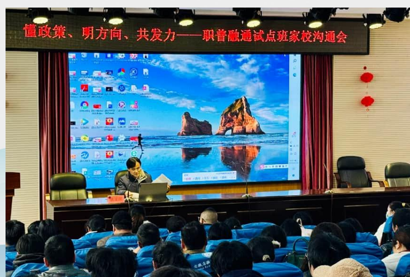
图 5 安徽省徽州师范学校职普融通班试点家长宣讲会

试点至今，学生既能巩固文化基础，又能接触专业技能，成长方向更清晰。学校也在实践中积累了职普课程融合、跨校协同办学的经验，为中职学校参与职普融通改革提供了可行样本。