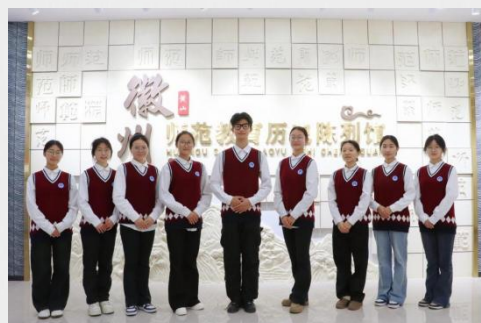
图 20 安徽省徽州师范学校校史馆