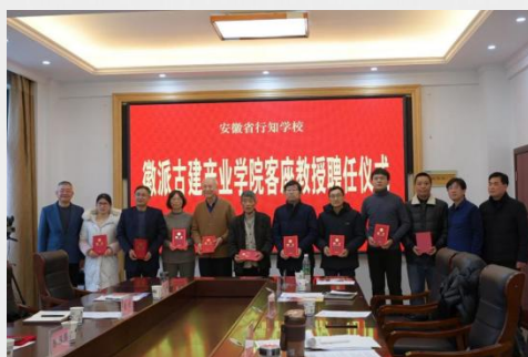
图 13 省徽派古建产业学院行业导师聘任仪式

三、筑牢产业学院发展根基。 学院坚持产业导向是根本，通过“共同”机制深度整合企业资源，实现校企优势互补、合作共赢，可有效破解“校热企冷”困境；推动“教学做”合一是核心，依托真实项目引领、大师教学赋能、技能竞赛驱动，实现理论与实践深度融合，才能切实提升学生综合职业能力。