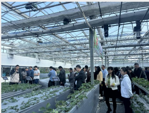
图 15 黄山炎培职业学校高素质农民培育技能培训班