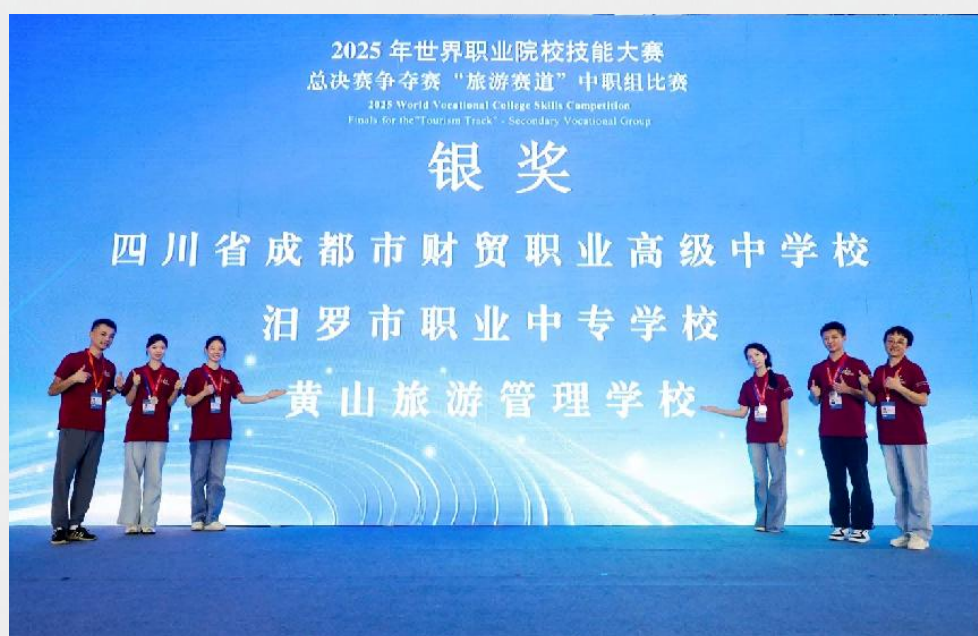
图 4 2025 年参加世界职业院校技能大赛获旅游赛道争夺赛银奖

功打造省级赛点，连续 8 年高质量承办世界职业技能大赛安徽选拔赛旅游赛道、安徽省职业院校技能大赛导游服务与酒店服务项目、黄山市中职技能大赛等多项重要赛事，推动全市师生深度参与赛事标准解读、竞赛流程实操，实现教学与行业前沿标准的精准对接。三是健全长效保障机制。为巩固赛事成果，全市中职学校构建完善备赛育人长效机制。赛前各校组建“选拔－集训－指导”一体化体系，通过严格选拔、集中实训及省内专家精准指导保障备赛成效；赛后第一时间召开全市总结会，组织各校复盘赛事、分享经验、梳理不足，成为全市“以赛育人”的生动典范。