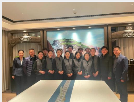
图 12 安徽省行知学校安排学生实习实训活动