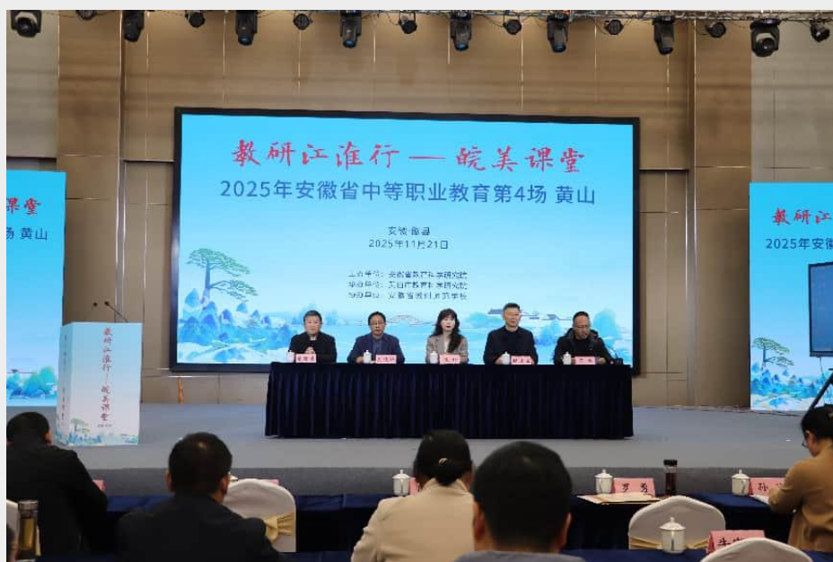
图3 2025年安徽省中职第4场“教研江淮行 皖美课堂”展示活动