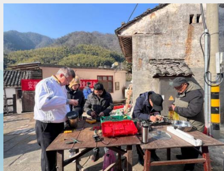
图9 安徽省行知学校开展电器维修下乡送温暖活动