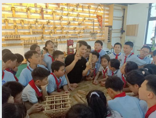
图 21 全市中小学赴休宁徽匠学校开展职业体验活动

墨描金体验课”“古建榫卯拼装实践”等实操课程，让学生感知传统技艺魅力；开展“职业认知周”活动，组织新生走进校企合作企业与校内实训基地，完成职业兴趣与岗位认知启蒙。 徽州师范学校 开设 10 门以上综合素质类选修课程，举办“斗山书院讲坛”“我知我行”风采展示，辐射师生超 3000 人次。与歙县城关幼儿园深化“班班师徒结对”；旅游、计算机专业学生分学段完成岗位实习。黄山炎培职业学校依托数控、汽修等骨干专业资源，建设职业启蒙教育体验基地，组建专业教师教学团队，开设课程有《汽车的起源和基本认知》《走进数控》《CAD 制图初探》等系列体验课程。2025 年累计接待约 400 名初三学生至数控、汽修实训车间开展职业体验活动。 休宁徽匠学校 将县“郑宝军技能大师工作室”作为职业启蒙（体验）教育的核心阵地，围绕木工专业特色，打造“一核多翼”的体验平台。开展“木工体验日”活动，2025 年覆盖 200 余名新生；校外与周边 5 所中小学签订合作协议，推出“职业体验进校园”“技能课堂进社区”专项服务。