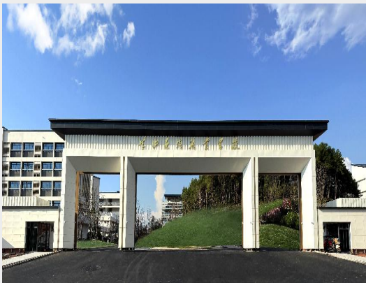
图2 黄山炎培职业学校高新校区