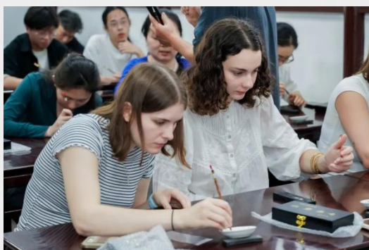
图 28 澳大利亚国家商业与技术学院赴炎培考察 图 29 上海师范大学留学生参与非遗描金技艺活动