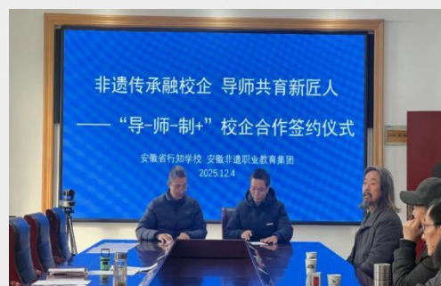
图 11 安徽非遗职教集团校企合作签约