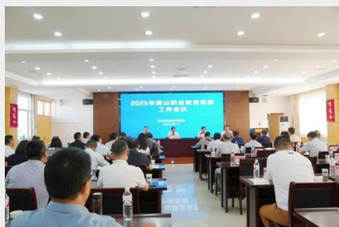
图 10 黄山职教集团 2025 年工作会议

推进全市职业教育规模化、集团化发展。安徽省行知学校牵头的省非遗职教集团联动旗下歙县徽文墨厂、歙县新中艺术砖雕厂、歙砚协会等 7 家非遗相关企业，遴选一批技艺精湛的企业导师——包括非遗项目传承人、行业一线技术骨干、非遗文创产业从业者等，全面参与学校的非遗教学与实践指导，打通“课堂学习 - 企业实践 - 岗位适配”的培育链路。黄山职业技术学院牵头的黄山职业教育集团召开 2025 年集团工作会议，听取了现代旅游、医药卫生和装备制造三个专业委员会建设情况汇报，就筹建教育文化类专业委员会进行深入研讨，并表决通过昌辉汽车电器（黄山）股份公司增补为集团理事会成员单位。安徽省行知学校、黄山职业技术学院分别牵头成立的徽派古建产业学院和黄山民宿产业学院，并成功立项省级现代产业学院培育单位。