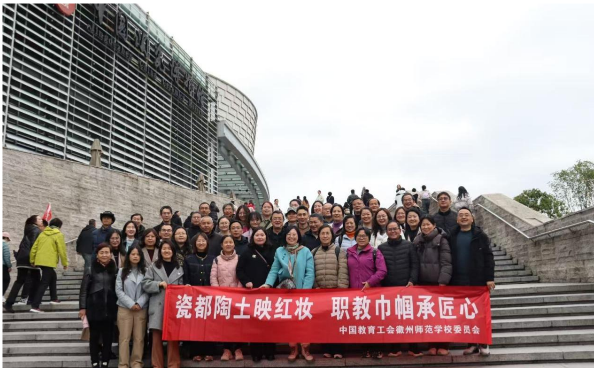
图 15 妇女节期间，学校女教师赴景德镇中国陶瓷博物馆开展“匠意体验游”

升。这种被关怀、被尊重的正向体验，转化为更强烈的集体荣誉感和投身职教事业的内驱力，为学校高质量发展注入了源源不断、和谐稳定的内生动力。工会作为“教职工之家”的纽带作用愈发凸显，持续护航学校迈向新征程。