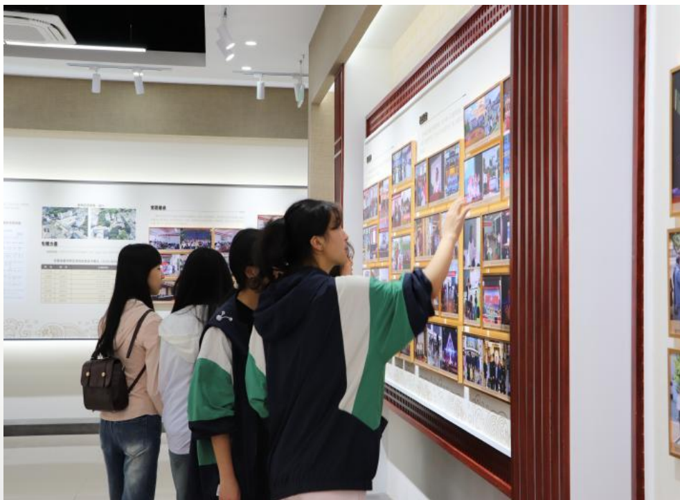
图 17 学生在参观徽州师范教育历史陈列馆

徽州师范教育历史陈列馆不仅是历史的保存者与展示者，更是师范精神的传承者与育人实践的创新者。它成功地将厚重的历史转化为滋养当下、启迪未来的教育力量。