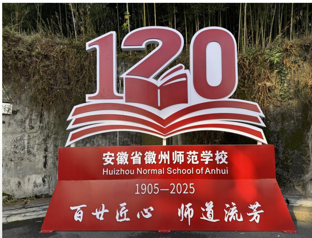
图 1 安徽省徽州师范学校 120 周年纪念牌

安徽省徽州师范学校坐落在“伟大的人民教育家”陶行知的故乡——歙县，是一所中等职业学校，也是黄山市中小学教师继续教育中心、黄山市教育培训基地。学校肇始于 1905 年许承尧创办的新安中学堂附设师范科，次年单设为徽州府紫阳师范学堂，2025 年迎来建校 120 周年。百余年来，为当地基础教育输送了大批优秀师资。1988 年受到原国家教委表彰，2016 年、2020 年分别被教育部认定为国防教育特色学校、全国青少年校园排球体育传统特色学校。2021 年被认定为安徽省合格中等职业学校。2022 年，入选安徽省中职学校“三全育人”典型学校、典型学部培育建设学校。