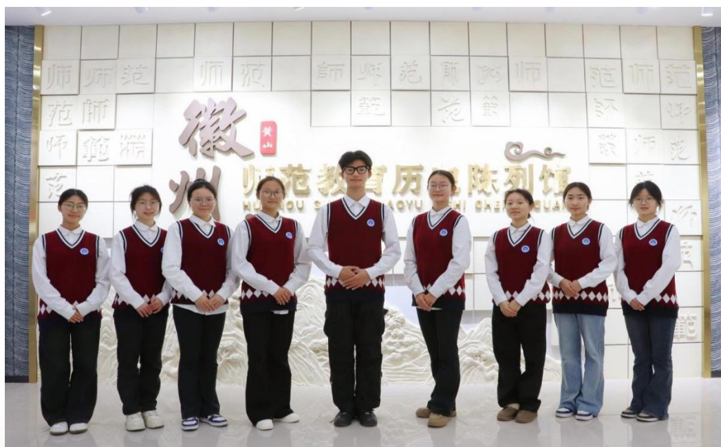
图 7 安徽省徽州师范学校校史陈列馆讲解队

面向学生：学校构建多元立体的育人平台，持续举办“斗山书院讲坛”“我知我行”风采展示等品牌活动；组建校史陈列馆讲解队；广泛开展职业技能竞赛集训、创新创业教育活动；组织丰富多彩的体育、艺术、读书创作及信息素养提升活动，学生参与度高，在省级以上各类竞赛中获奖丰硕，满足了学生个性化发展与综合素质提升的需求。