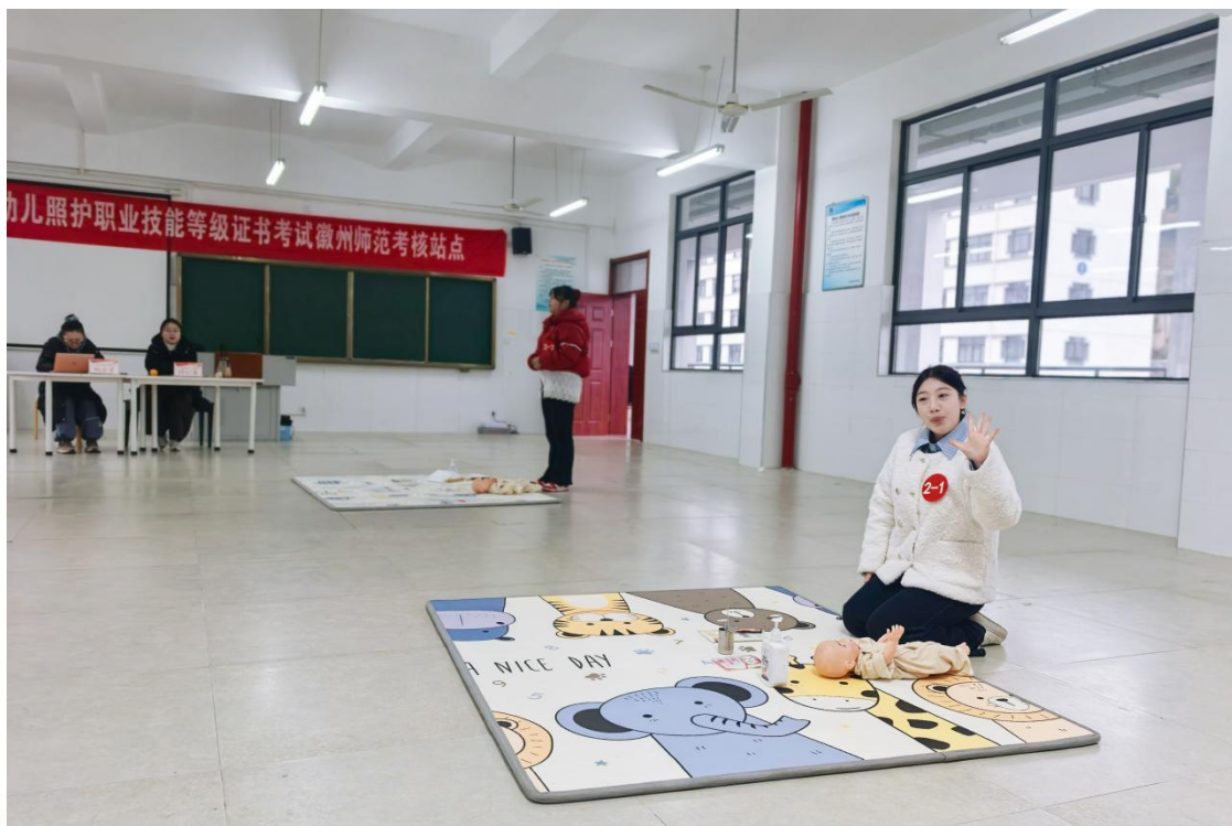
图6 学生参加1+X 幼儿照护实操考试

二是深化育训结合，拓展成长通道。学校通过多种途径，强化学生实践技能，并为其未来发展搭建“立交桥”。坚持“实习实训一体化”，本学年共组织近千人次赴幼儿园、企业等开展见实习和岗位实习，并举办实习分享会促进交流。“1+X”证书制度稳步推进，1+X幼儿照护职业技能等级证书考核通过率达到100%。此外，还完成了NIT认证、普通话测试、1+X器乐艺术指导、书画等级考试等多种职业技能等级证书的考核工作，提升了学生的综合就业竞争力。