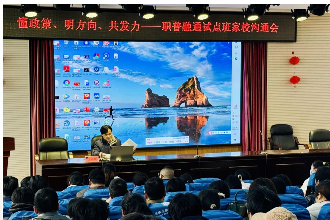
图 11 职普融通试点班家校沟通会

试点至今，学生既能巩固文化基础，又能接触专业技能，成长方向更清晰。学校也在实践中积累了职普课程融合、跨校协同办学的经验，为中职学校参与职普融通改革提供了可行样本。