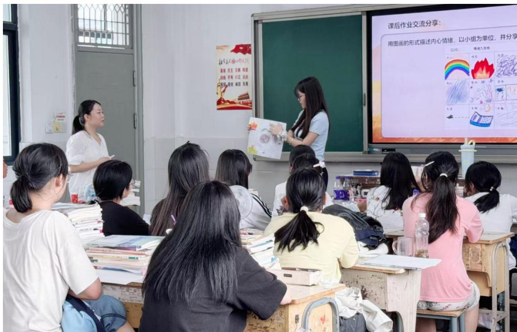
图 20 徽州师范学校转岗教师在进行授课

转岗教师指定一名新岗位领域经验丰富、业务水平突出的教师担任专属导师，实行为期2年的“一对一”精准指导，内容包括教学技能打磨（针对教学岗位）、工作经验传承、职业规划引导等，全方位助力转岗教师适应新角色。