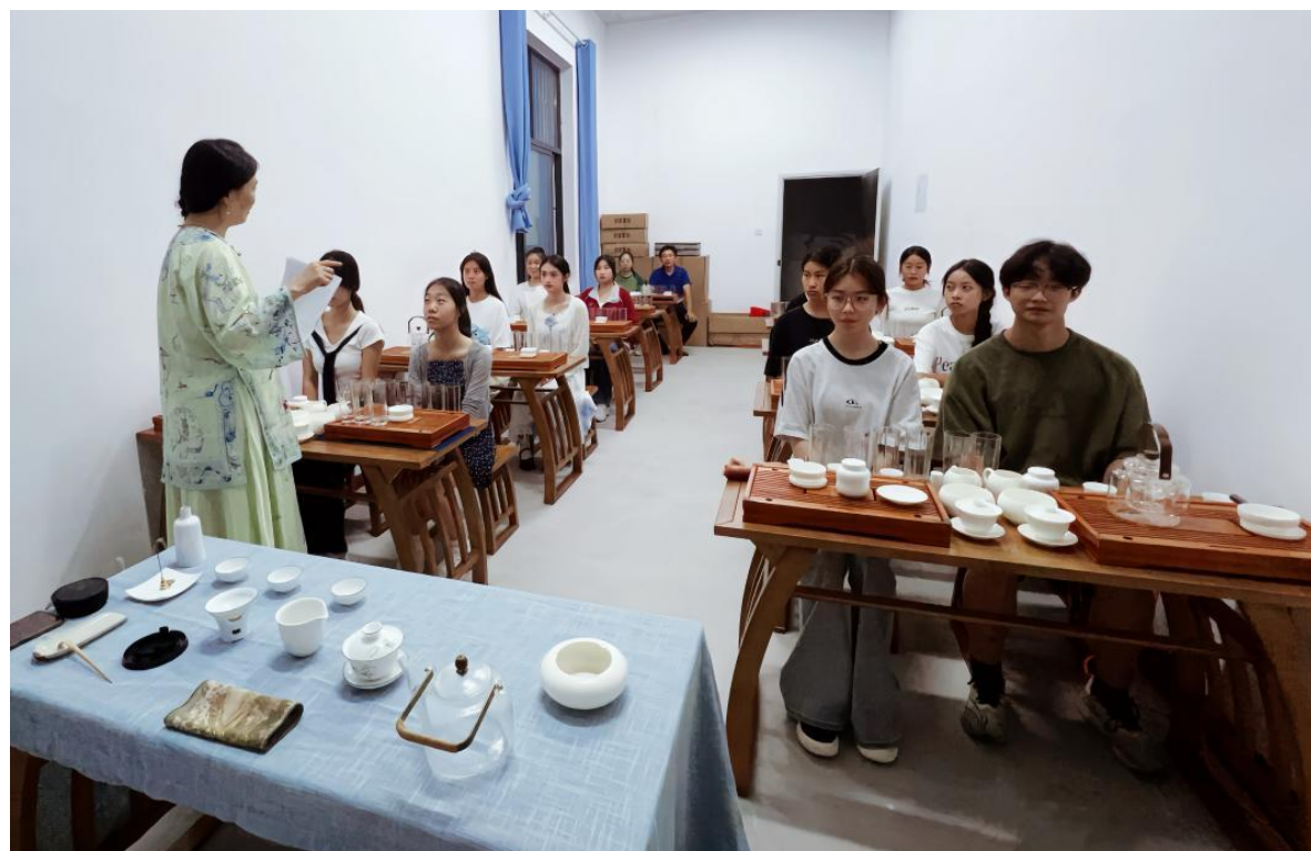
图 8 安徽省徽州师范学校开设《茶艺》选修课

优化课程体系结构：实施学部制管理，推动各专业教育教学从学科本位向专业本位转变。围绕专业发展需求，积极开发与区域文化、新兴产业结合的课程，如新设《徽州鱼灯的制作与表演》《茶艺》等选修课选修课。紧扣职普融通试点工作要求，统筹推进方案编制、师资调配、教材征订等全流程筹备工作，确保试点任务落地见效。