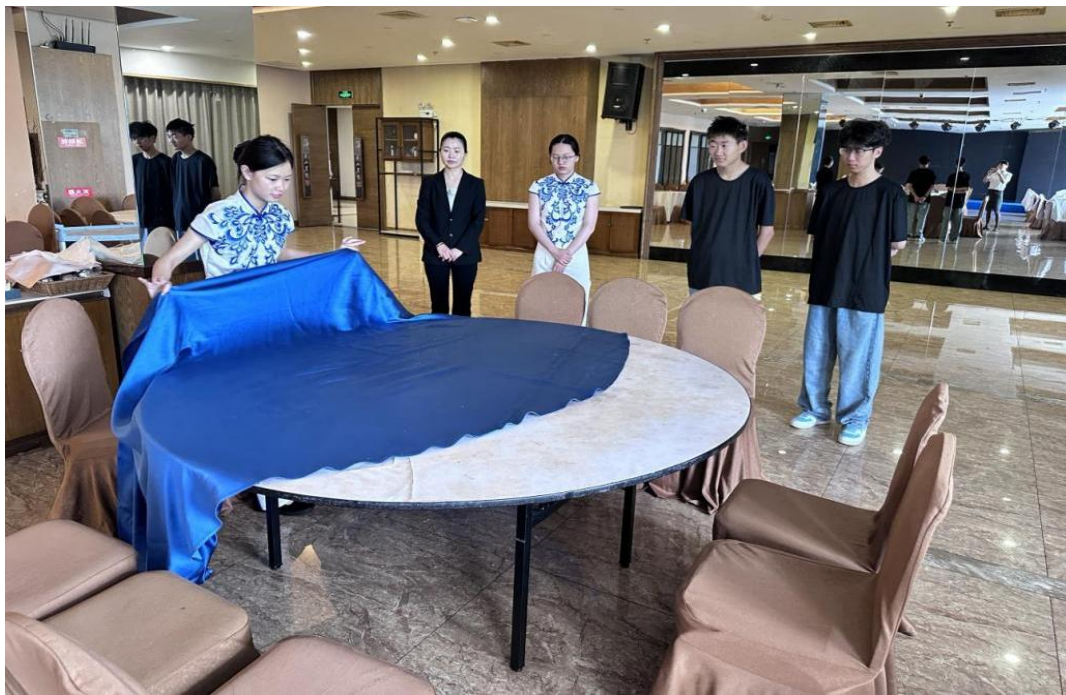
图 21 旅游专业学生在酒店进行餐桌布置

多元化的就业渠道。最终，学校通过输送高素质技术技能人才，直接服务于黄山市文旅康养、学前教育等重点产业的发展，实现了校、企、生、区域多方共赢的良性循环。