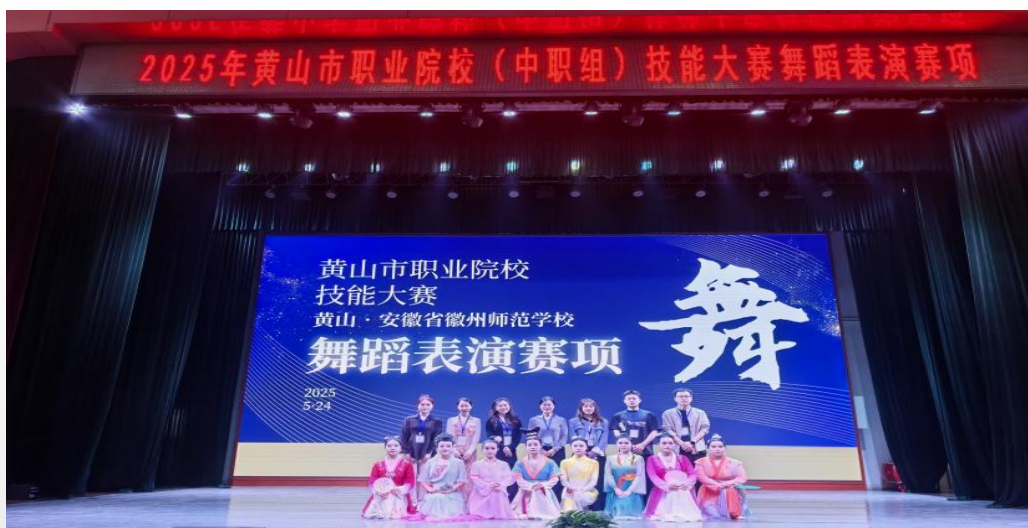
图 5 2025 年黄山市职业院校（中职组）技能大赛舞蹈赛项徽州师范学校赛点

一是以赛促教促学，大赛成绩斐然。学校将技能大赛作为检验教学质量、提升师生技能水平的关键平台，形成了“校赛-市赛-省赛”三级选拔与培养机制，成绩突出。校级集训队制度成效显著，在原有基础上本年度新增了CAD、艺术设计、PYTHON、短视频制作 4 个赛队，使校级集训队总数达到 14 个，覆盖了主要专业领域。学校还成功承办了市级 5 个技能大赛赛项，展现了学校的组织能力和专业水平。在 2025 年 1 月举办的省赛中，学生表现出色，共获得省级一等奖 1 项、省级二等奖 2 项、省级三等奖 3 项，涉及美术造型、舞蹈表演、幼儿教育、婴幼儿保育、数字孪生技术应用等多个项目。在 5 月举办的全市中职学生技能大赛中，参赛的 51 人共获得一等奖 5 项、二等奖 9 项、三等奖 11 项，获奖率达到 67%。