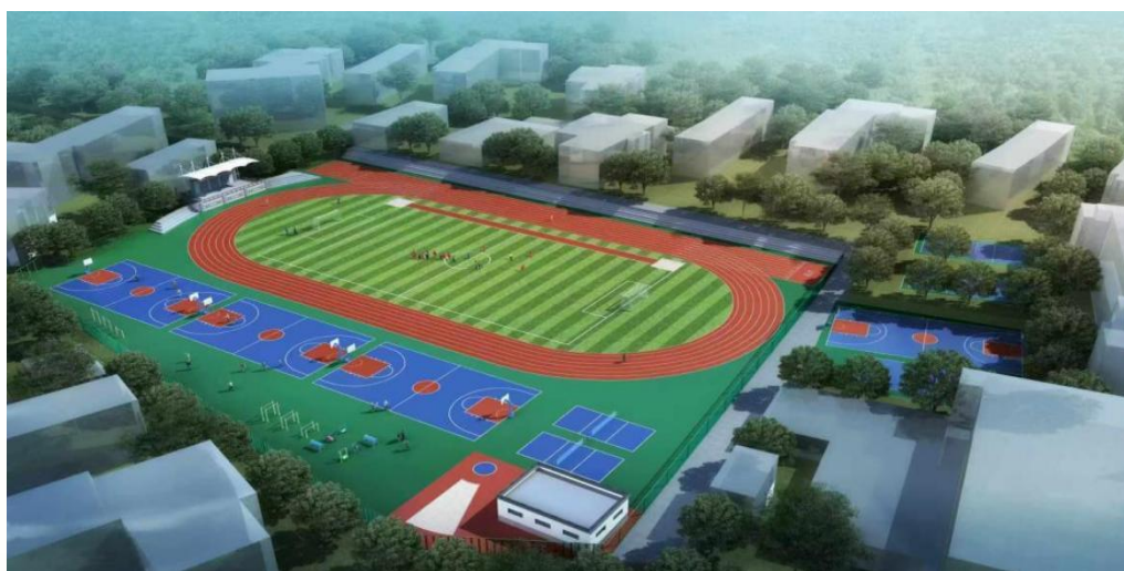
图 25 学校操场设计图

此项目从5月开始启动，8月底完工，总投入约175万元。由专业人员设计、编制工程量清单、招标和工程监理。项目内容包括：更换250米田径场、器材区及周边塑胶面层；更换篮球场、排球场及周边的硅PU面层；清理原有排水沟及盖板，检修原有排水沟及更换损坏盖板；更换篮球架及运动器材；加装气排球场固定网柱及球网；根据运动场原施工图纸，复核场地标高，优化场地排水；原有足球场草坪凹陷修复；更换跳远跑道区跳板及沙坑沙子等。项目实施过程中，场地布局严格遵循原有规划，所采用的材料、器材均符合国家相关规范标准，兼具环保性与安全性；改造后的场地视觉设计明快活泼，充满活力。