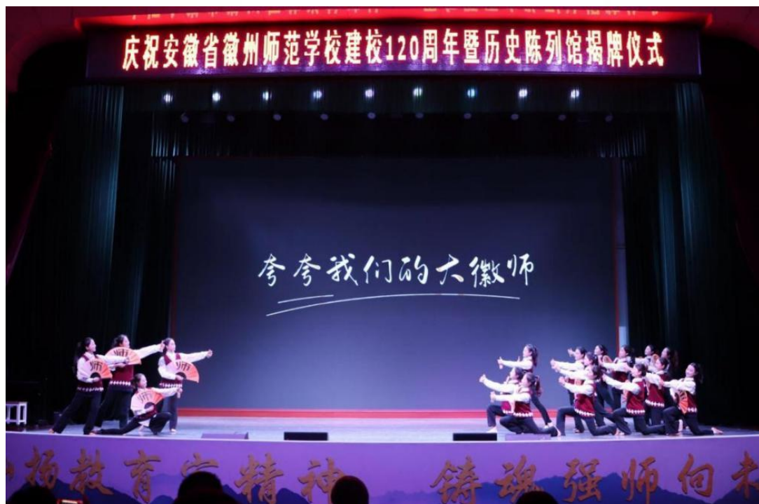
图 2 安徽省徽州师范学校建校 120 周年活动

此次系列活动的成功举办，不仅彰显了“爱国爱乡、坚韧不拔、业务精湛”的徽师精神，更通过历史传承、实践育人、辐射带动的多元举措，为职业教育创新发展提供了可借