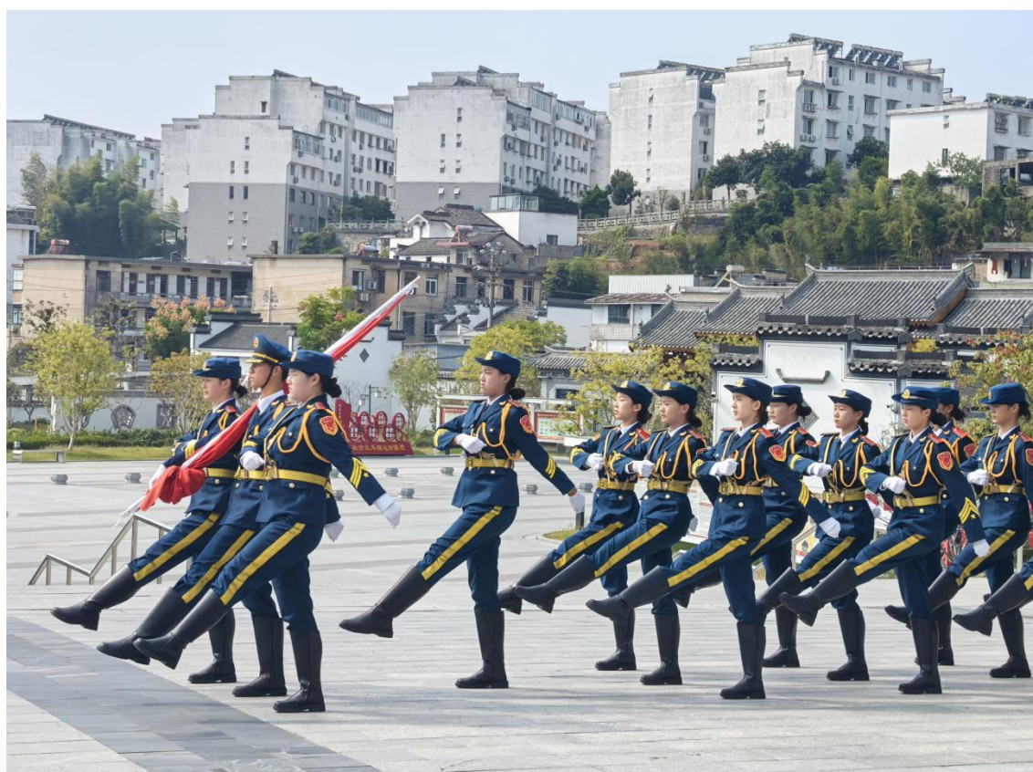
图 16 国旗护卫队在屯溪六中展示

保专业 296 人入驻城区 7 所幼儿园开展 1-2 周见实习，与歙县城关幼儿园深化“班班师徒结对”；旅游、计算机专业学生分学段完成 2-4 周岗位实习或 1 周校内实训，校企协同效应显著。同时，完成 2022 级转段考试，46 名学生参加高考报名，24 人通过高职院校分类考试确认录取，9 人参加普通高考均上高职专科线，22 幼 1 班胡佩琪同学艺考文化课超本科线 30 分，为学生职业发展与升学搭建多元通道。