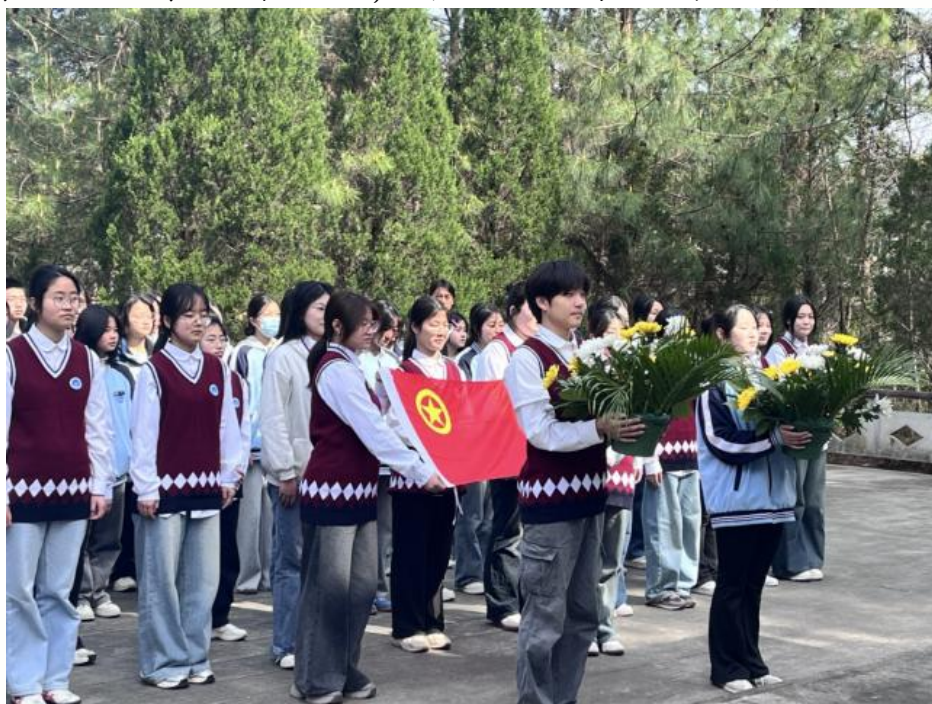
图 18 2025 年徽师团校学员赴大山公墓开展清明祭扫活动

两项活动一静一动、内外衔接，形成了沉浸式、序列化的红色教育体验。学生在祭扫中凝神静思，在研学中行走体悟，展现出高度的投入与深刻思考。活动后，学校组织心得分享、主题展演等活动，推动红色学习持续深化。