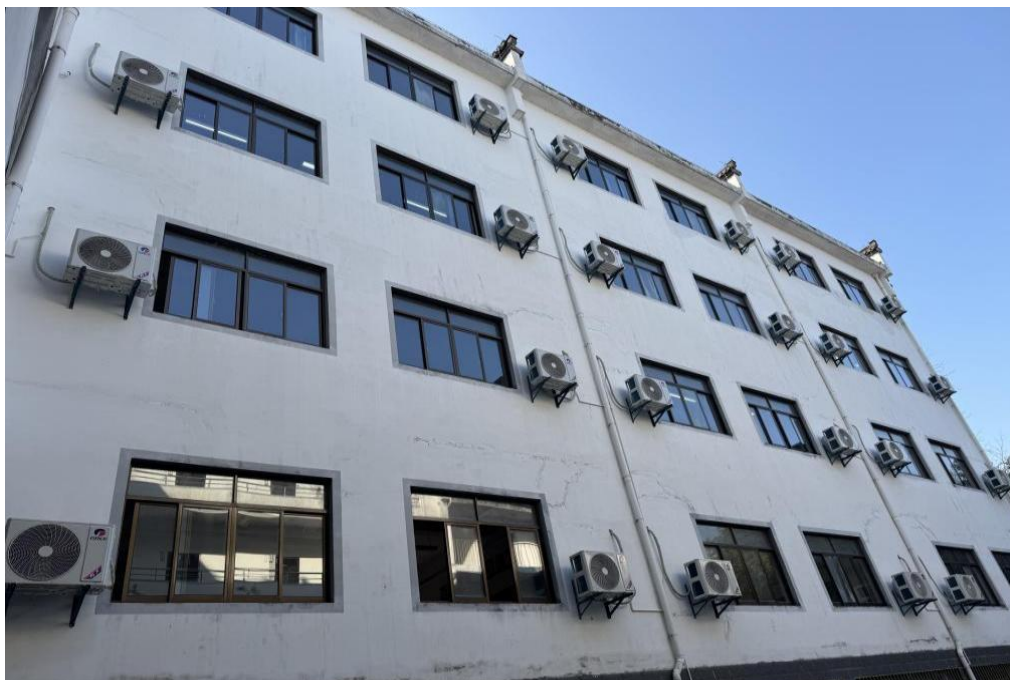
图 26 学校教室安装空调

为确保工程精准落地、高效推进，学校在项目启动前做了充分准备。对全校普通教室做了详细调研，如教室面积、现有电路负荷、空调安装位置等。并据此科学确定了空调的数量和适配机型。7月下旬完成了空调线路改造和空调机采购的招标工作。8月，在总务处的统筹协调和监督下，工人们冒着酷暑加班加点，于8月25号同步完成了教室空调线路改造和46间教室92台3匹冷暖空调机的安装调试。