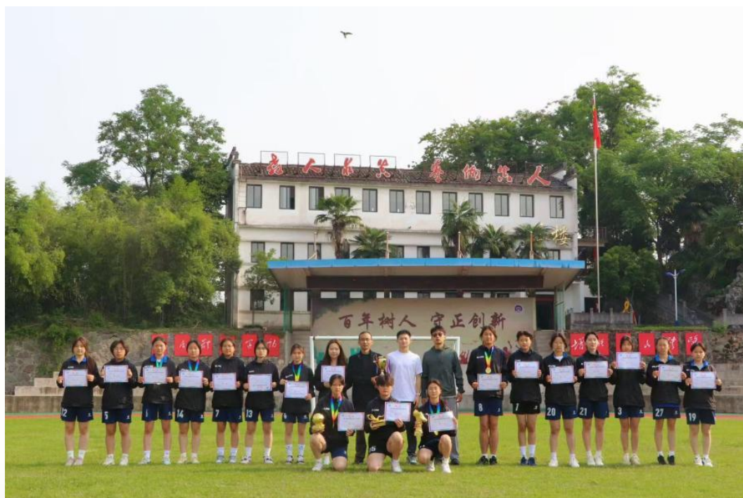
图4 学校女子足球队在黄山市校园足球联赛中夺得高中女子组冠军

体育强健：高度重视学生体质健康，体育AI运动吧正式启用，极大激发了学生锻炼热情。成功举办第47届综合运动会、全校篮球赛、跳绳比赛等体育活动，并在黄山市校园足球联赛中夺得高中女子组冠军及多项个人荣誉，学生体育素质明显增强。