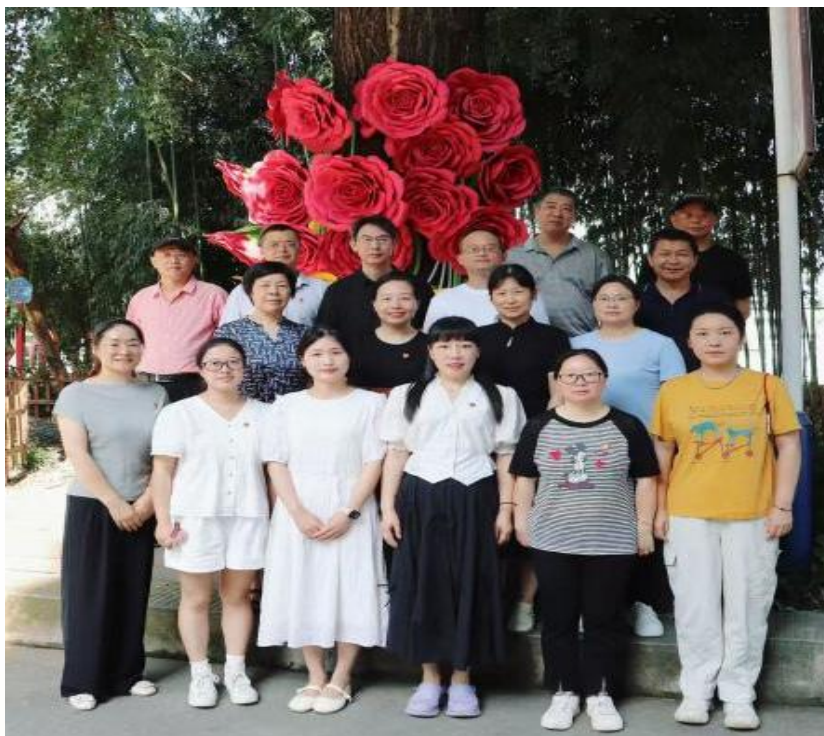
图 24 7 月 1 日党的生日，学校第一党支部党员合影留念

月 1 日党的生日这个特殊而光荣的日子里，学校一支部举行党员纳新仪式，顺利吸纳一名优秀同志入党，为党员队伍增添了新生力量，激发了支部党建工作的生机与活力。在做好党员发展的同时，注重加强日常教育管理，规范开展组织生活会、民主评议党员、谈心谈话、“三会一课”和主题党日活活动，引导党员在教育教学、学生管理和服务师生中亮身份、作表率，发挥先锋模范作用。