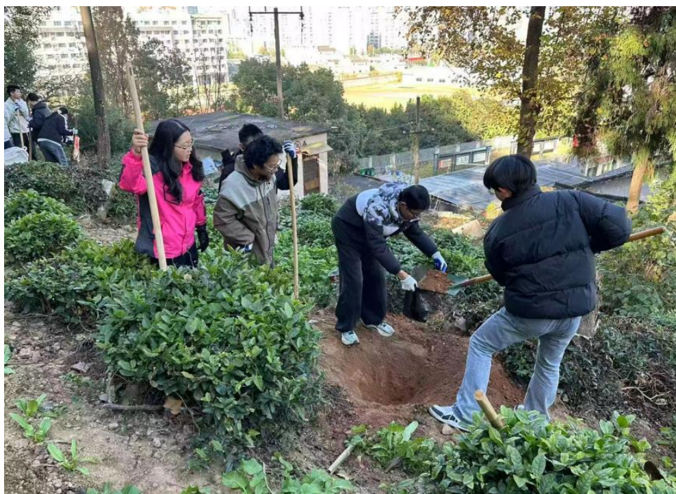
图 10 学校教师带职普融通试点班学生到茶博园采集土壤标本

探索职普融通教学模式：为迎接职普融通试点，教务处于零开始，系统设计教学方案、配备师资、遴选教材，充分发挥黄山市田家炳实验中学作为“试点共同体”在教学教研方面的帮扶引领作用，开展两校间的集体备课和交流研讨等活动，并尝试在联合备课机制的建立、示范课例的开展、课题合作研究等方面进行新的探索。