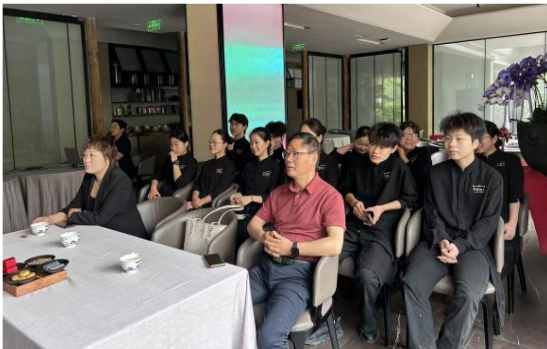
图 13 旅游管理专业的学生在酒店进行培训

学生们凭借扎实的专业知识和良好的职业素养，圆满完成各项工作任务，得到了实习单位的高度称赞与认可，为校企后续深化合作奠定了坚实的实践基础。