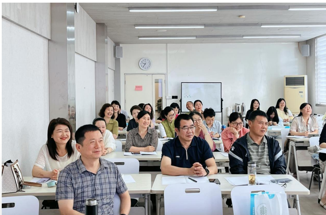
图 14 黄山市初中、小学、幼儿园书记、校（园）长在华东师范大学培训

区域教育队伍专业成长，新教师培训夯实了职业基础，班主任培训提升了育德能力和心理辅导技能，校（园）长培训增强了领导学校改革发展的能力，管理干部培训激发了创新管理思维，全员远程培训则持续保障了教师队伍整体知识的更新与拓展；学校的培训品牌与基地影响力同步提升，通过成功承办一系列高质量、有特色的培训项目，安徽省徽州师范学校作为“黄山市教育干部培训基地”的专业能力、资源整合能力和组织管理水平得到市教育局及各参训单位的充分肯定，与国内知名师范大学的合作经验，也为未来拓展更广泛、更深层次的培训合作奠定了坚实基础，基地的品牌效应和区域影响力进一步凸显。