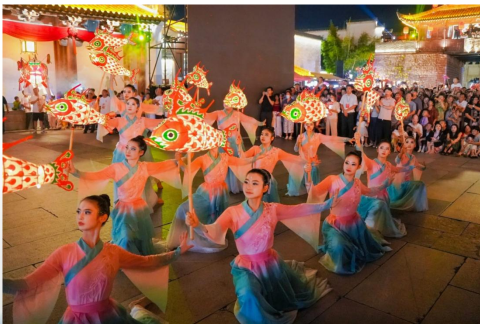
图 23 舞蹈类原创作品《鱼影润新安》

双方以徽州特色“鱼”文化为核心纽带，深入挖掘地域文化内涵，共同打造系列舞蹈类原创文艺作品。继《鱼影润新安》成功引爆全网后，重点打造《鱼跃龙门》系列标杆作品。歙州农文旅集团负责提供专业演出平台、外聘行业创作教师、保障相关创作及演出经费；徽州师范学校则负责组织学生、进行作品创意构思、专业艺术指导及节目编排、演出。双方紧密合作，确保作品兼具高艺术水准与强文化传播价值，作品版权归双方共同所有，实现了文化与艺术的完美融合。