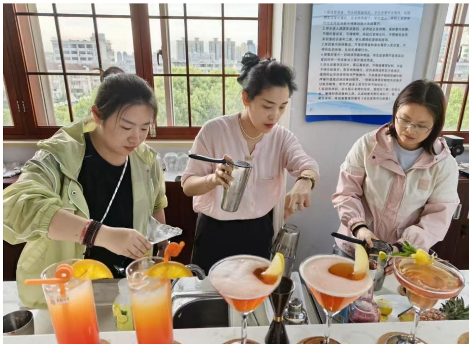
图 19 徽州师范教师赴上海师范大学附属杨浦现代职业学校学习

有效强化了徽州师范教师的专业技能，更将上师附职“理实一体、以赛促教”的核心职教特色融入其旅游专业建设，为专业发展注入全新思路。