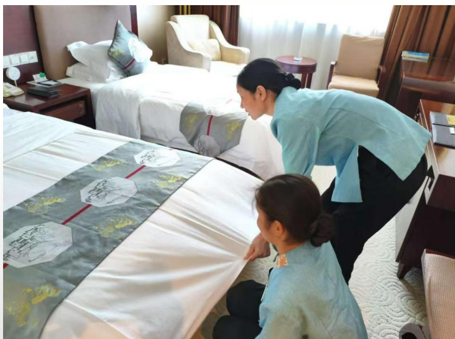
图 22 旅游专业学生在酒店进行专业实践

学生入企实践，实习单位覆盖黄山国际大酒店、昱城皇冠假日酒店、天都国际酒店等核心运营场景，涉及餐饮服务、客房管理、前厅接待等关键岗位。企业选派业务能力强、责任心强的经理担任实践导师，负责岗位任务安排、技能指导与日常管理；学校同步派驻专业教师跟班，承担学生思想引导、学业监督与问题协调，形成“企业管技能、学校管成长”的双重保障机制。实习前，双方通过访企拓岗活动明确岗位要求与实习标准；实习中，建立“每日记录、每周沟通、每月评估”的跟踪体系；实习后，联合开展考核评价，结果纳入学生学业成绩。